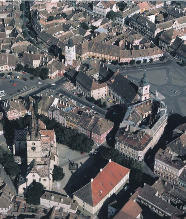
Hermannstadt, Europäische Kulturhauptstadt 2007, Sitz kirchlicher und politischer Vertretungen der Siebenbürger Sachsen.

Nur noch 15.000 Siebenbürger Sachsen leben in Siebenbürgen. Ihre politischen Interessen werden vom „Demokratischen Forum der Deutschen in Rumänien“ vertreten, das sich auch um die Wahrung der kulturellen Identität bemüht. Den völkerrechtlichen Rahmen dafür bieten der im April 1992 zwischen Rumänien und der Bundesrepublik Deutschland geschlossene Freundschaftsvertrag, das Kulturabkommen von 1995 mit Bestimmungen zum Schutz der Minderheit und ihrer Kultur und die EU, der Rumänien seit 2007 angehört. Trotz ihrer geringen Zahl, ihrer Diasporasituation und ihrer Altersstruktur nimmt die siebenbürgisch-sächsische Minderheit eine völkerverbindende und friedenssichernde Brückenfunktion wahr, die auch von der Bundesregierung mit finanziellen Mitteln gefördert wird.