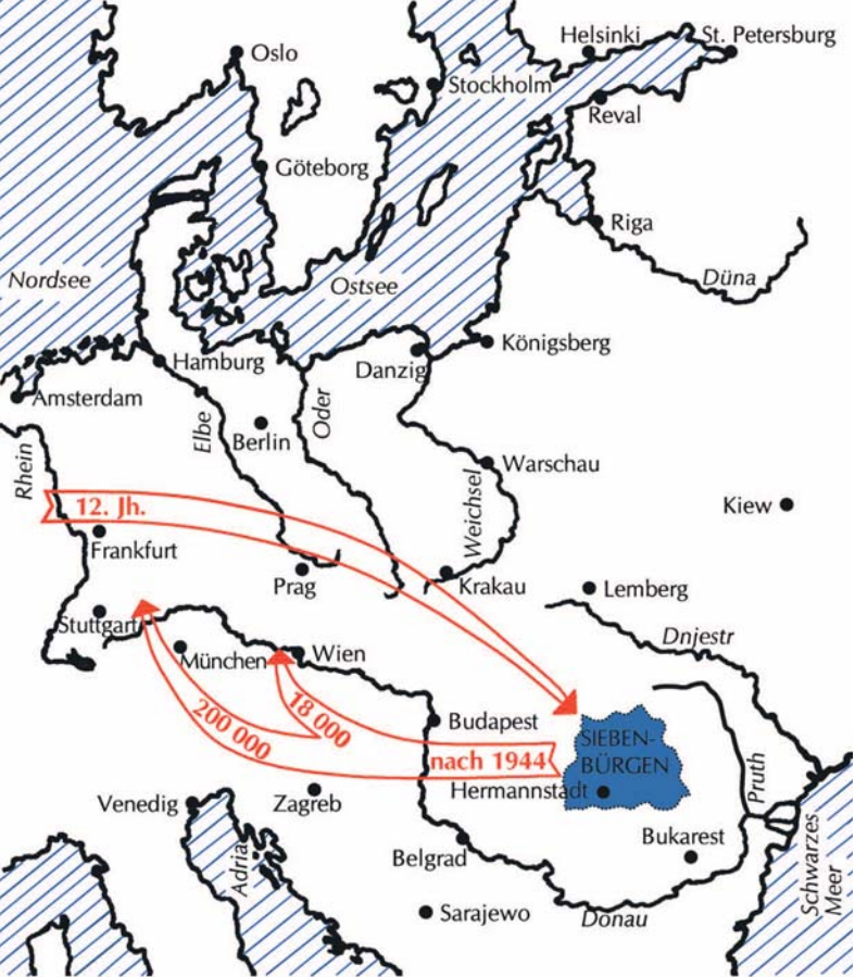
Karte: Hans-Werner Schuster

Im 12. Jahrhundert folgten Siedler aus dem deutschen Reich dem Ruf des ungarischen Königs nach Siebenbürgen. Durch die Anpassung an die Verhältnisse vor Ort und im stetigen Austausch mit dem Herkunftsraum konnten sie ihre kulturellen Werte bewahren und weiterentwickeln: wirtschaftliches und technisches Know-how, religiöse Überzeugungen und tradierte Sitten, deutsche Sprache und Kultur sowie ausgeprägte Freiheitsliebe und Toleranz. Ihr Siedlungsgebiet mit Territorialautonomie haben sie als Kulturlandschaft geprägt und ein Gemeinwesen aufgebaut, dessen Einrichtungen das Wohl des Einzelnen wie das der Gemeinschaft förderten. Als staatstragende Nation haben sie die Geschichte Siebenbürgens mitbestimmt und ihren Beitrag zur Entwicklung Ungarns sowie des Habsburgerreiches geleistet. Die Kriege und Wirren des 20. Jahrhunderts haben die Gemeinschaft der Siebenbürger Sachsen dezimiert und auseinander gerissen. Die Mehrzahl von ihnen lebt heute in Deutschland.