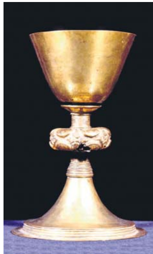
Abendmahlskelch, Siebenbürgen, ~ 1400.

Der Sturz CEAUŞESCUs und seines Regimes am 22. Dezember 1989 leitet eine politische Wende ein. Für die Siebenbürger Sachsen kommt die Entwicklung Rumäniens hin zu einem demokratischen Rechtsstaat und zu wirtschaftlicher Gesundung zu spät: Im Bestreben der Verfolgung und dem staatlichen Druck zu entgehen, wächst sich die kurz nach Kriegsende einsetzende Familienzusammenführung zur Aussiedlung und 1990 zum Massensexodus aus. Heute leben rund 200.000 Landsleute in Deutschland, 20.000 in Österreich, 25.000 in den USA und 8.000 in Kanada.