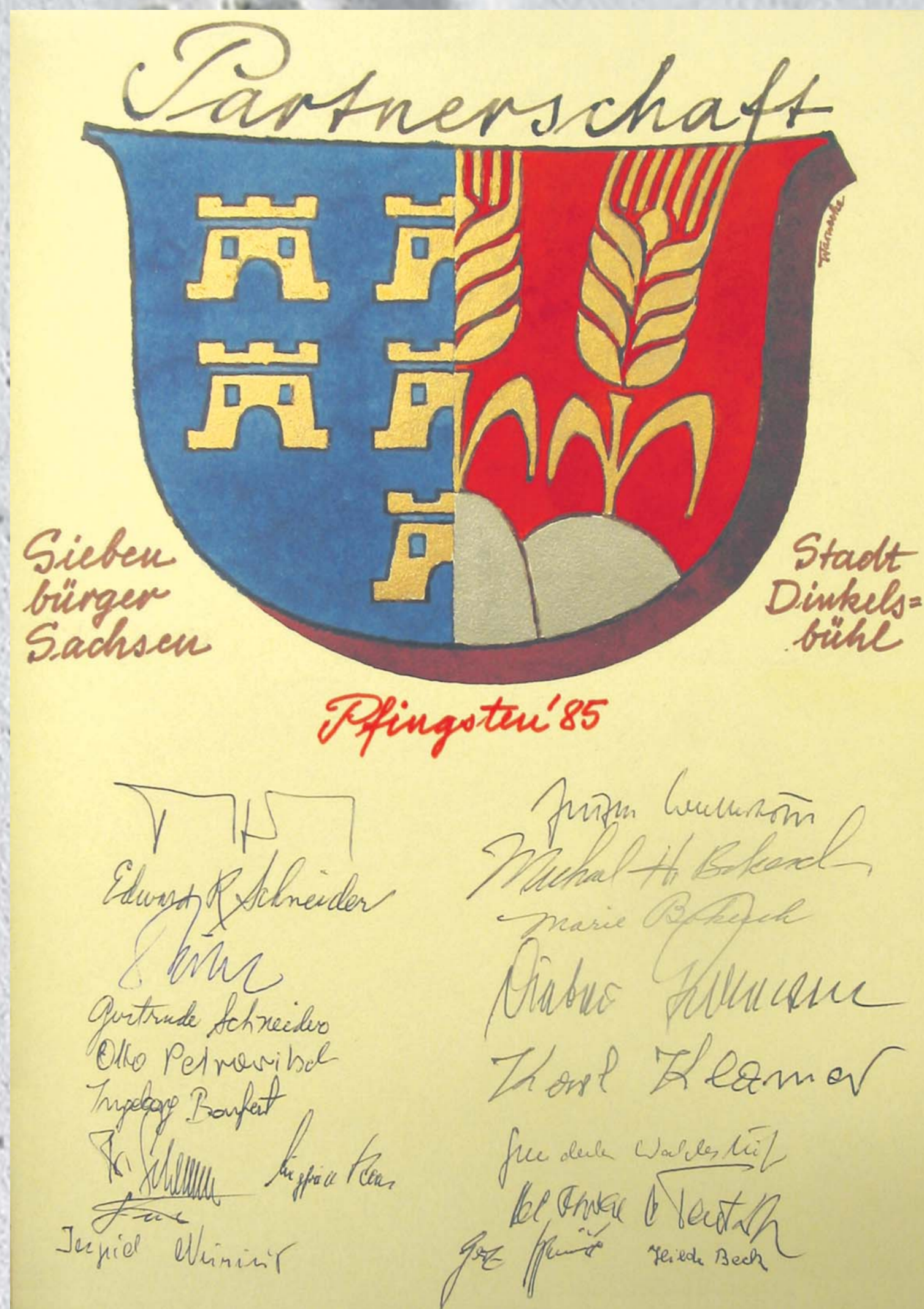
Schmuckseite mit von RUDOLF WARNECKE symbolträchtig gestaltetem Wappen im Ehrenbuch der Stadt Dinkelsbühl.